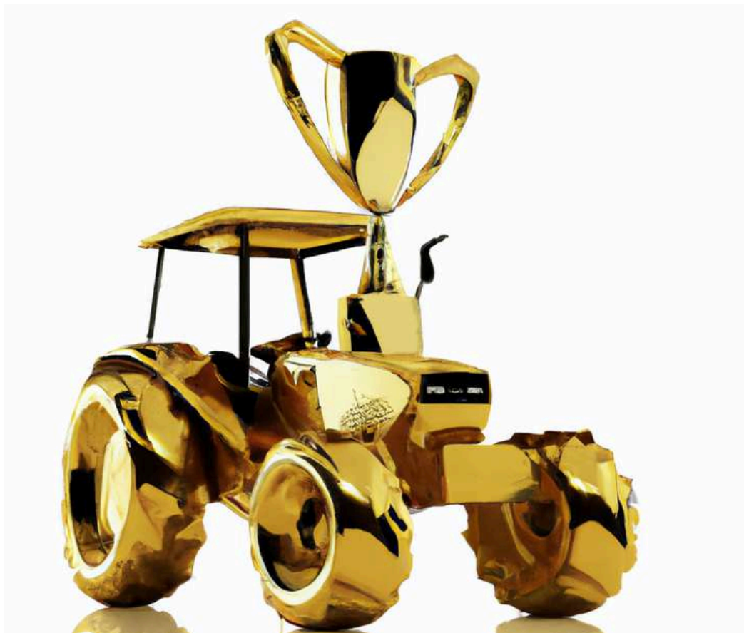
Gouden Trekker Award

Team Agro NL reikt sinds 2019 De Gouden Trekker Award uit aan iemand die zelf geen boer is, maar zich wel hard maakt voor de agrarische sector en actief bezig is met promotie van de Nederlandse land- en tuinbouw. Dit kan overigens ook een organisatie betreffen in plaats van een persoon. In 2024 gaan wij wederom op zoek naar een nieuwe nominatie.